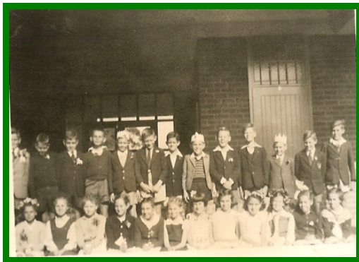
Leerlinge – 1953