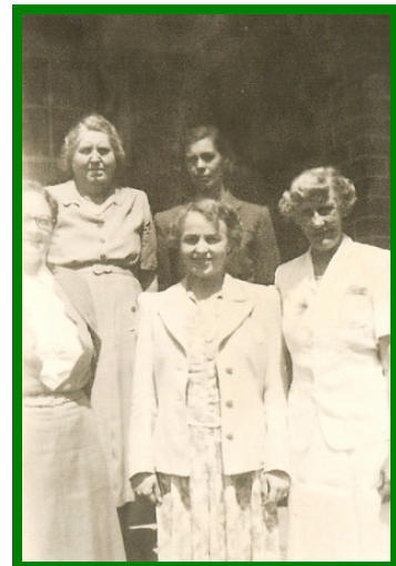
Die eerste onderwysspan van 1953