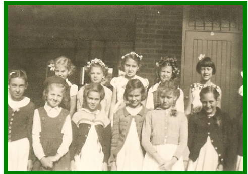
Lentedag – 1953