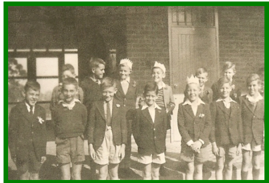
Leerlinge – 1953